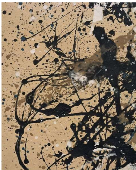
Jackson Pollock Autumn Rhythm (Number 30)